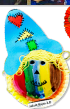
Reportáž pripravila: Anetka Gužiňáková 2. D