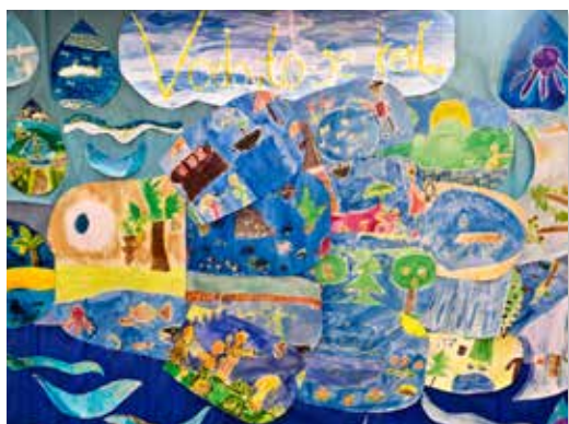
Voda vo výtvarnej tvorbe našich žiakov