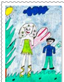
Klára Barutíková 4. A: Rozprávkový svet