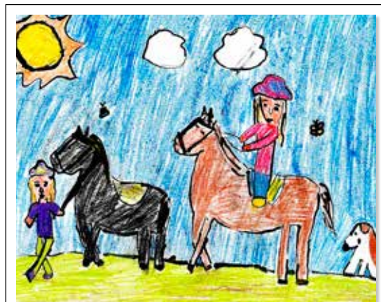
Alžbetka Somsedíková 4. A: Ako trávim voľný čas