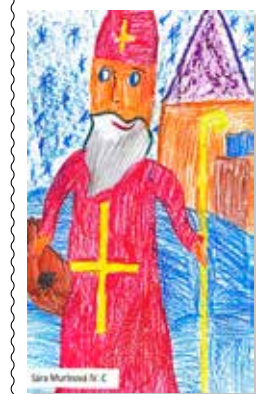
Sára Murínová 4. C: Svätý Mikuláš

Lenže čo to? Zrazu som počula len buchot