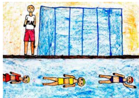
Adriána Raticová 4. B