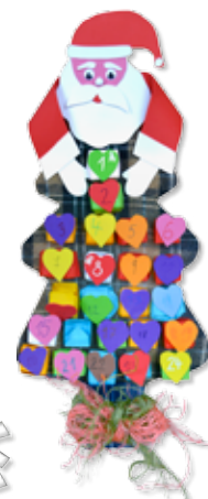
kolectív 4. B