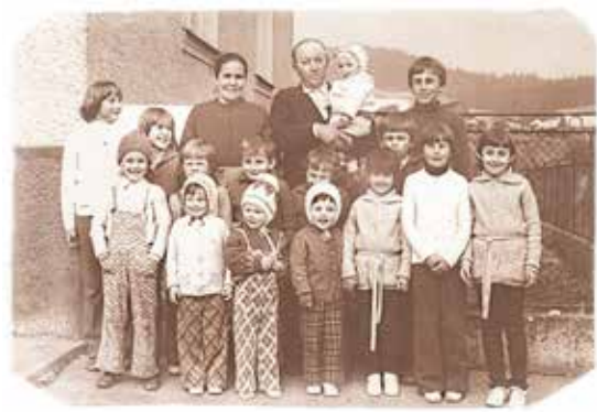
žená v našom starom fotoalbume.

Odzrazu sme pocítili silnú túžbu spoločne sa vyfotiť. Usporiadali sme sa a krsťná mama stlačila spúšť. Vznikla pekná fotografia, ktorá je dodnes ulo-