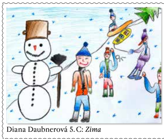
Diana Daubnerová 5. C: Zima

• Žiaci našej základnej školy sa zapojili do projektu „ Srdce pre Elku “, a tak sa pomocou detí a ich rodičov vyzbieralo viac ako 350 € a 66 kg uzáverov z plastových fľaš, čo veríme, že aspoň takáto malá pomoc nevidiacej Elke pomôže.