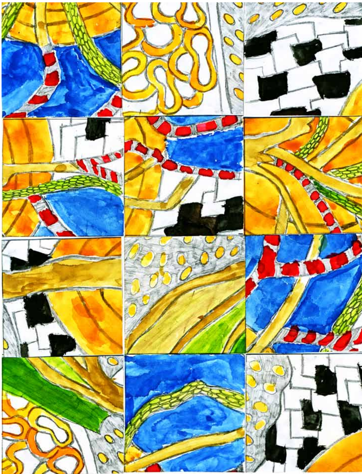
VYSRIHNI A POSKLADAJ OBRÁZOK BARBORY GUŽTKOVEJ, 8C