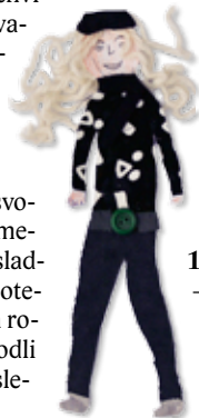
Karneval v MŠ

Všetci boli za svoju námahu odmenení hračkou a sladkosťou. Vyhodnotenie mali v rukách rodičia, ktorí rozhodli o umiestnení nasledovne: