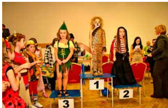
Karneval v Kultúrnom dome v Rabči