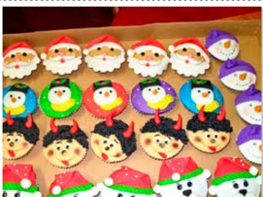
Mikuláš v MŠ