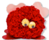
Dominika Jagelková, 4. B