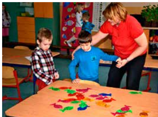
Zápis do prvého ročníka

• školská súťaž v stavaní snehových bytostí sa uskutočnila 30. 1. 2013;