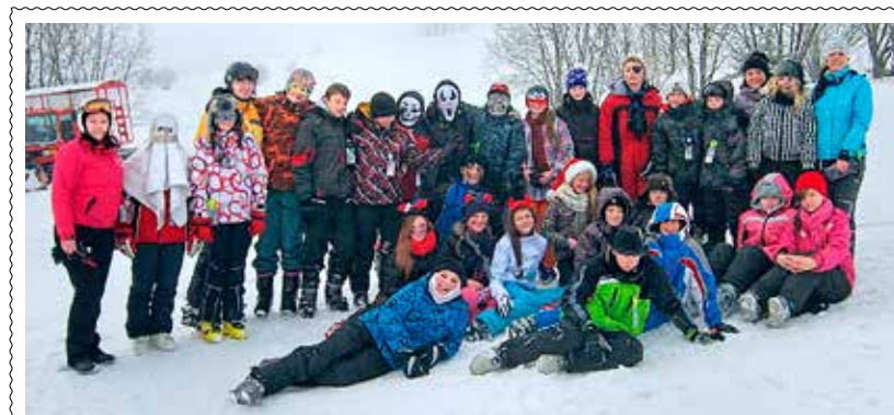
Karnevalový lyžiarsky výcvik