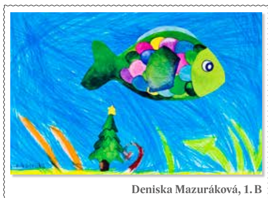
Deniska Mazuráková, 1. B

Vyškrtajte literárne pojmy: aliterácia, anafora, báseň, detektívka, epigram, epitaf, epizeuxa, epos, kniha, poézia, presah, próza, román, óda, idea