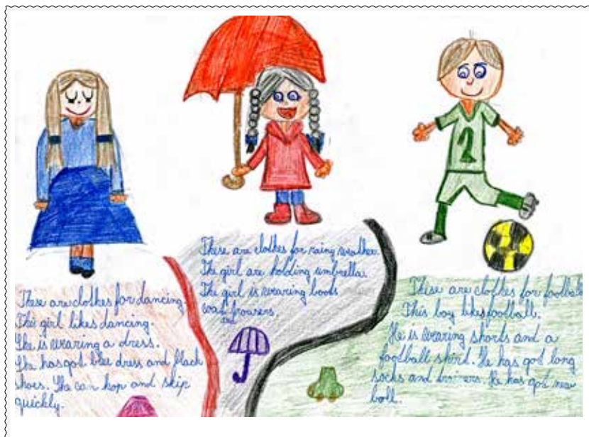
Projektové vyučovanie angličtiny na 1. stupni, autor: Dominika Jagelková, 4. B