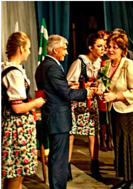
Z 50. výročia školy – ocenenia