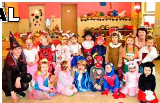
Karneval v MŠ