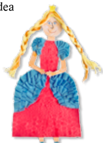
Sára Bjalončíková 4. A

Vyškrtajte literárne pojmy: aliterácia, anafora, báseň, detektívka, epigram, epitaf, epizeuxa, epos, kniha, poézia, presah, próza, román, óda, idea