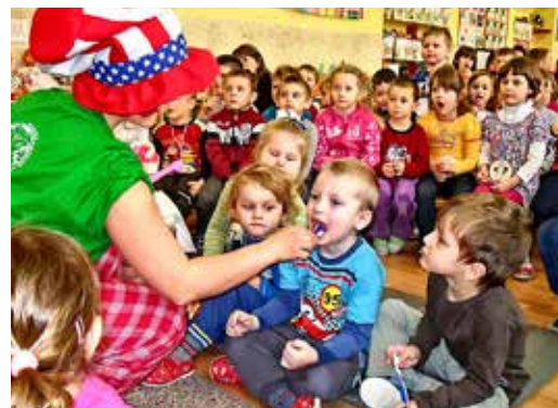
Prednáška v MŠ o zúbkoch

• vo februári 2013 sa uskutočnil lyžiarsky výcvik siedmakov, ktorého spretrením v závere bolo lyžovanie v maskách a preteky v zjazdovom lyžovaní, ktorých výsledky si môžete pozrieť na www.zsrabca.sk pod záložkou „Novinky“; • celoslovenské testovanie žiakov 9. ročníka z matematiky a slovenského jazyka – Testovanie 9 sa