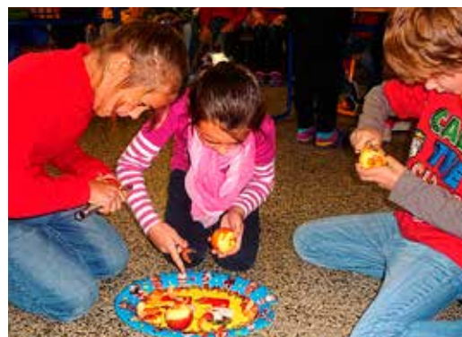
Deň jablka v ZŠ