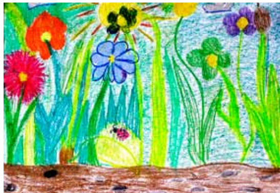
Simona Revajová 6. C