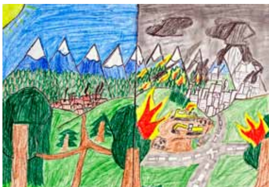
Paľko Kovaliček 6. A

Nerubme stromy, pretože vytvárajú kyslík. Kys-