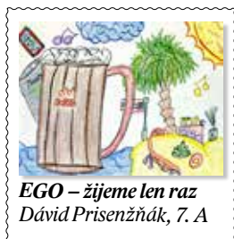
EGO – žijeme len raz Dávid Prisenžňák, 7. A