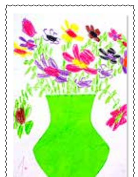
Michal Fusko, 1. B