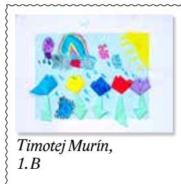
Timotej Murín, 1. B