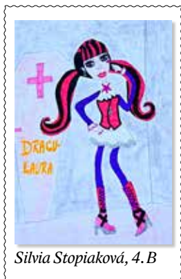
Silvia Stopiaková, 4. B