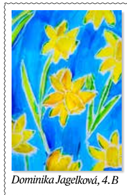
Domínika Jagelková, 4. B