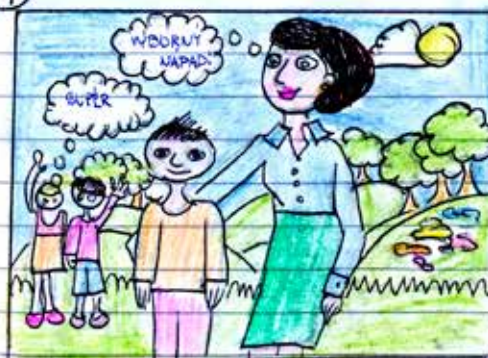
Alžbeta Slovíková, 7.A