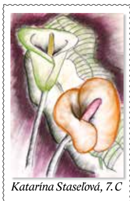
Katarína Staselová, 7. C