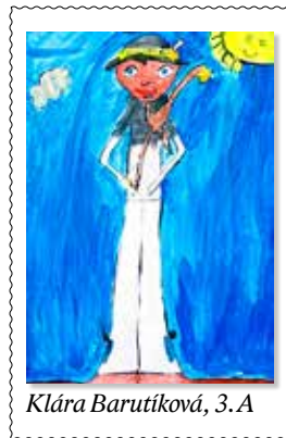
Klára Barutíková, 3. A