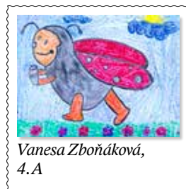
Vanesa Zboňáková, 4. A