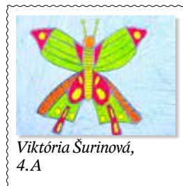
Viktória Šurinová, 4. A