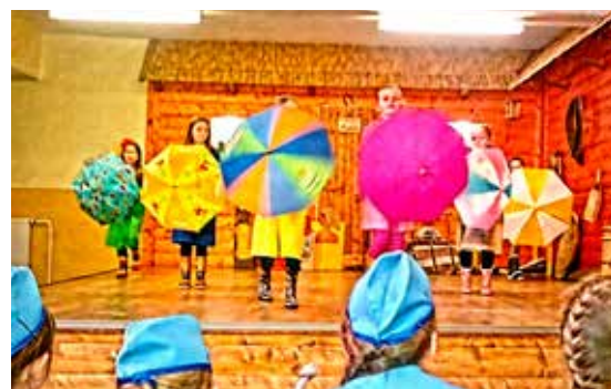
Deň učiteľov – program detí