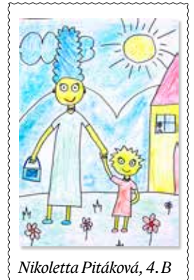
Nikoletta Pitáková, 4. B